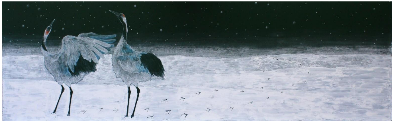
日学・黒板アート甲子園®2025大会 最優秀賞作品 「仙鶴の逢引」 (埼玉県立大宮光陵高等学校)